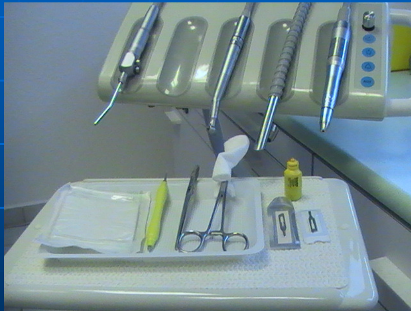
Anticipation plateau technique D'un soin ongle incarné