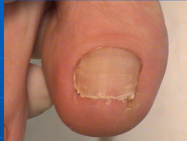
Double Ongles incrustés