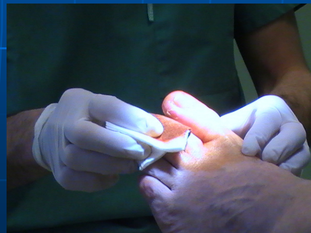
Asepsie de la zone avec Bétadine dermique 10%